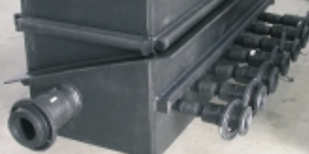
BRONGAS KIST GP GROOT